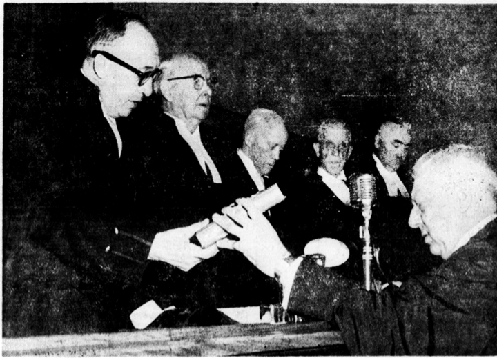
Assermentation de l'hon. juge Paul Miquelon

La Cour Supérieure a accueilli dans ses rangs, ce matin, un nouveau juge en la personne de l'honorable PAUL MIQUELON, ci-devant procureur de la Couronne senior pour le district de Québec. On l'aperçoit ici alors qu'il prête le serment d'office